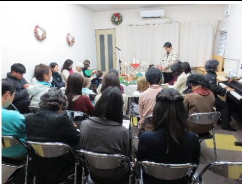
▲キャンドルサービスの様子

12月のクリスマスに向けて、11月30日に、諸教会の皆様のご協力をいただき、7000枚のチラシを配りました。マンションでは、「チラシ不要」のシールが貼られているところが散見されるのですが、お一人の方からクレームの電話をいただきました。しかしながら、15日の礼拝は、30人の参加でしたが、そのうちチラシを見て来られた方がお一人いました。その日の午後のお楽しみ会は、子ども13人、大人21人の参加でしたが、そのうち二組の親子がチラシを見ての参加でした。22日のクリスマス礼拝は、27人の参加で、家族や友人に誘われて初めて参加した方が3人いました。23日のキャンドルサービスは昨年に続き、素敵な